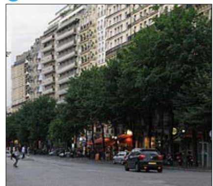
Tänkbar vy från Södertäljevägen mot öster.