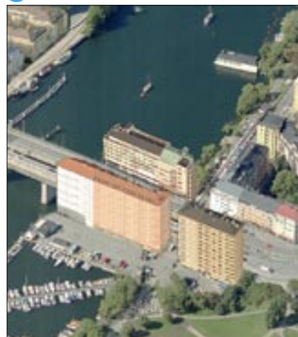
Korta gärna Liljeholmsbron genom att bygga hus ut i vattnet.