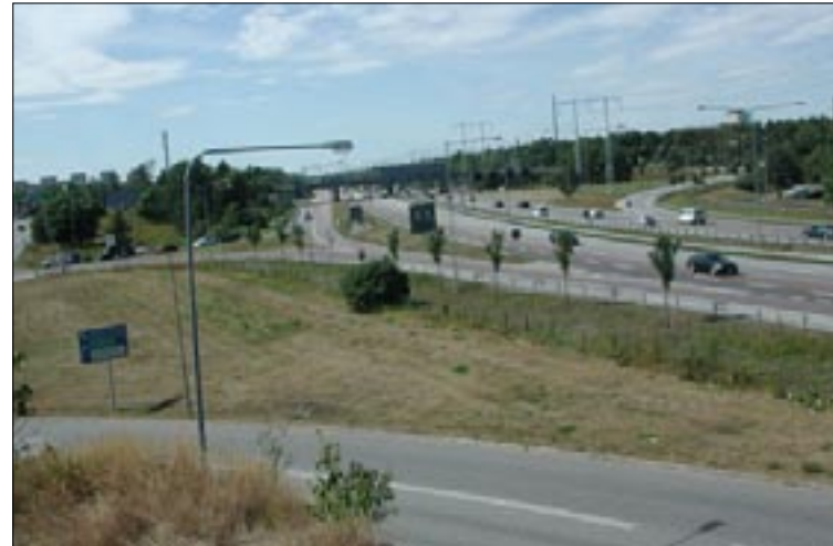
Ovan en av Stockholms skamfläckar – öken mellan Fruängen och Västertorp. Skulle kunna ge plats för en tät stadsdel med gångavstånd som den till höger – och erbjuda bostäder i bra läge för tiotusentals människor!

Idag står folk i kö och är beredda att betala idiotpriser för att få bo i innerstan. Det beror på att det är tätt, att det finns mycket