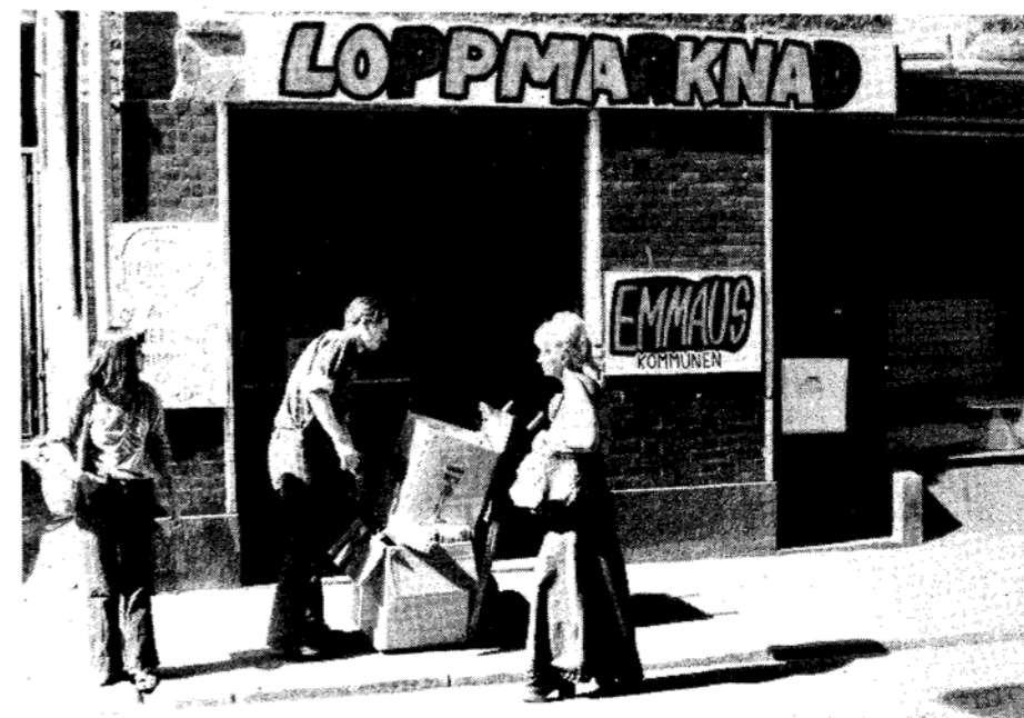
Emmaus, som samlar in kläder och annat till stöd för afrikanska befrielseörelser, har flyttat till Årsta från lokalerna på Luntmakargatan (bilden).