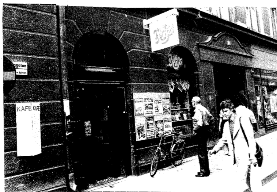
Bokcaféet Morianen på Drottninggatan fick lägga ner när departementen kom.

Markpriserna i innerstan stiger till fantasiummor. Men utanför tullarna sjunker de tvärt. Det återspeglar inte bara de fortfarande nåtsånär låga hy- rorna i närförorterna, utan också den glesa bebyggelsen. Frågan är om den är alltför gles för att tillåta liv. När veden makas isär dör elden.