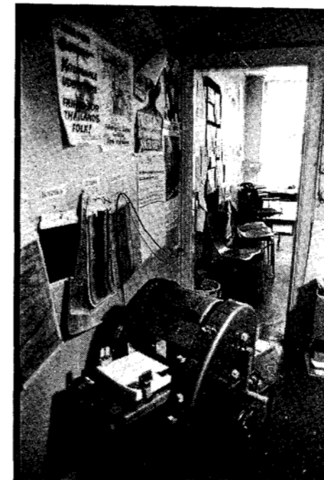
Såna här anspråkslösa lokaler går det numera inte att hitta i innerstan, och inte nån annanstans heller.

När man har detaljstuderat vad som händer i nordamerikanska städer när